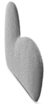
Design bracciolo basso