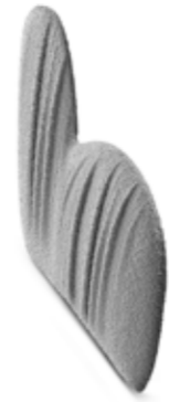
Décò bracciolo basso